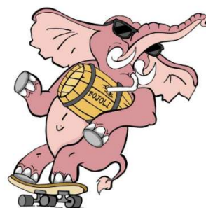
1 Logo de la société de Jeunesse

La société de Jeunesse de Prévonloup compte actuellement 28 membres âgés entre 16 et 29 ans. Notre but est de favoriser les rencontres, les amitiés et les moments de loisirs entre les jeunes de nos villages. La jeunesse regroupe les six villages au code postal 1682. Chaque année, nous organisons plusieurs manifestations sur les communes de Dompierre et de Prévonloup ; une vente des œufs de Pâques, un tour de jeunesse comprenant des tournois sportifs ainsi qu'un bar et de la restauration durant 3 jours, le 1 er août villageois et nous terminons l'année avec une soirée « fondue vigneronne » qui accueille chaque année environ 230 personnes. Ces diverses manifestations nous permettent d'acquérir plusieurs connaissances, que ce soit dans la gestion administrative en amont de la fête, les préparatifs, la gestion d'un tournoi sportif ou encore celle d'une cuisine.